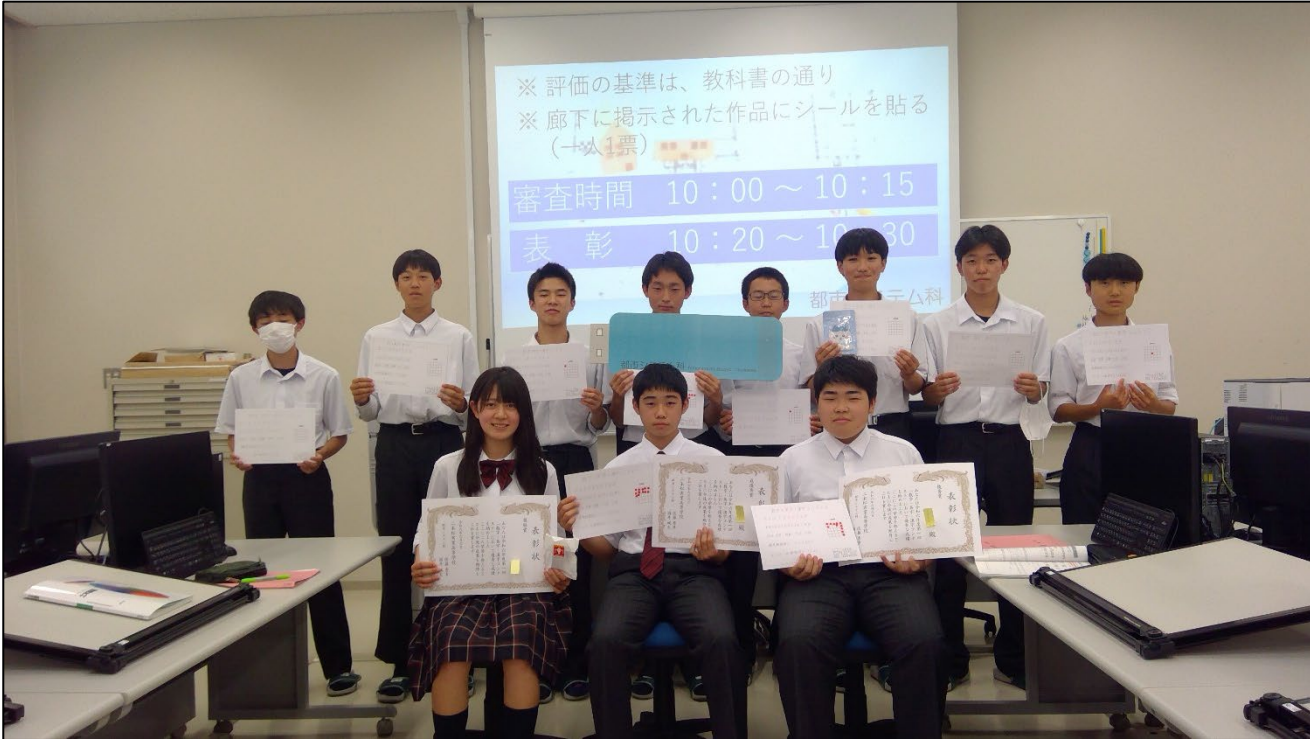
上位 11名の生徒たち