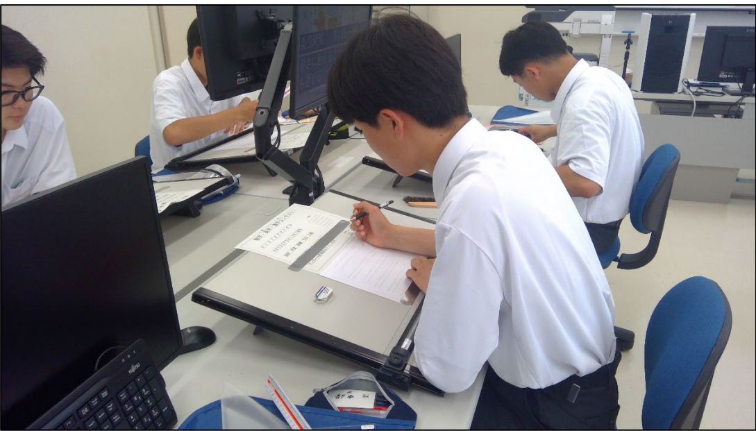
真剣な様子の K 君