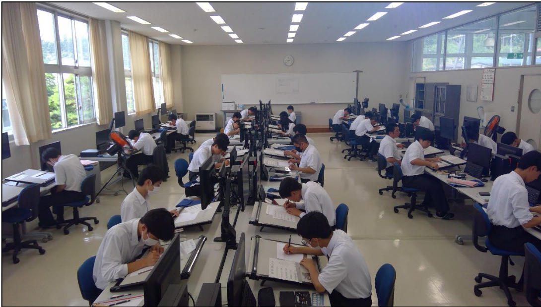
コンテストの様子

1年生の製図の授業で「数字・英字・漢字コンテスト」と題した定着度を図るイベントを行いました。製図の基礎となる線の使い分け(太さや濃さ)ができていることや読みやすいか・均一であるか・複写に適しているかといった評価基準のもと、生徒は白紙から図面を完成させました。完成した図面は廊下に貼り出し、生徒自らが良いと思う作品に票を入れるという方法で評価をし合いました。緊張感をもってコンテストに臨む多くの生徒たち。これまでの努力の結晶ともいえる甲乙つけがたい作品ばかりでコンテストは大成功に終わりました。