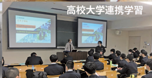
高校大学連携学習