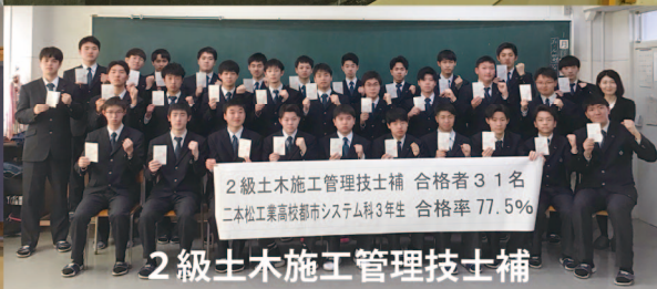
2級土木施工管理技士補