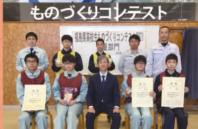
ものづくりコンテスト