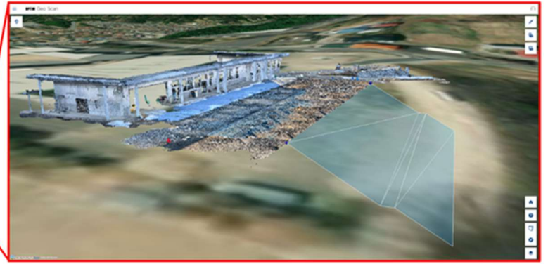
Geo Scan した直後のデジタルデータ