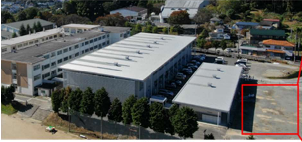
本校都市システム科 測量グラウンド